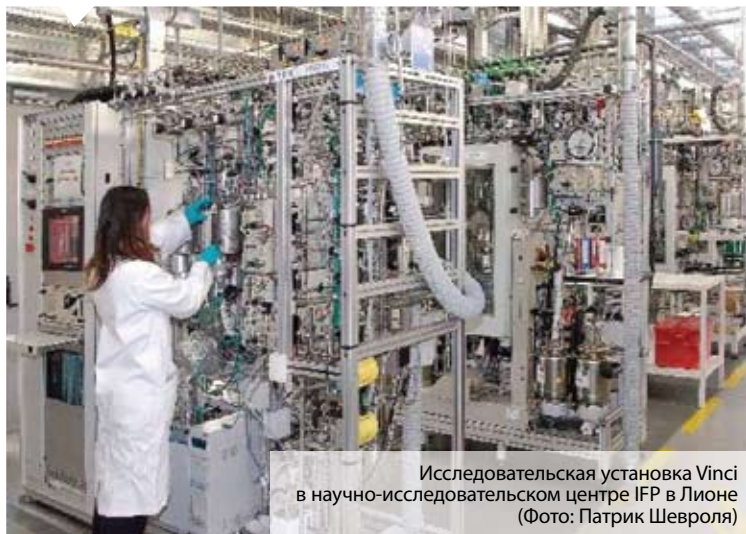
Исследовательская установка Vinci в научно-исследовательском центре IFR в Лионе